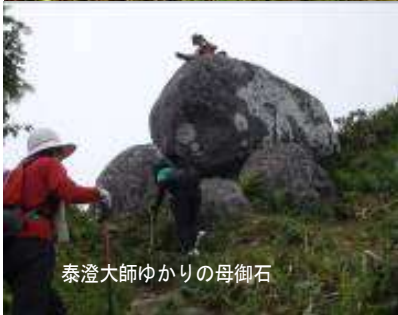
泰澄大師ゆかりの母御石

参加費(一人 500 円)当日受付にて 傷害保険加入費・オリジナルバンダナ代 小・中学生は半額