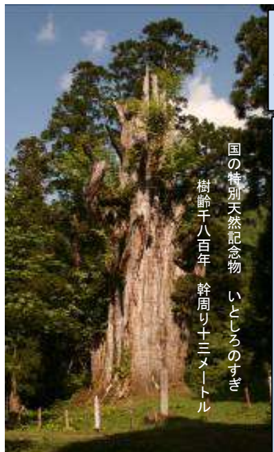
国の特別天然記念物 いとしろのすぎ 樹齢千八百年 幹周り十三メートル

白山をめぐる美しい自然と古い歴史のなかで、石徹白地域が連綿として残してきた行事の一つに、回り番で奉仕する『白山道刈り』があった。村の住人は四、五年に一度回ってくるこの行事に義務として参加し、先輩古老と寝食を共にすることを繰り返すうちに、知らず知らずに地域の歴史や、道筋の社の神々のことを教えられ、泰澄大師開闢の由来や、御山へ登る尊さが語り伝えられて来た。 しかし、石徹白も次第に過疎化が進み、ついに昭和五十四年を最後にこの伝統行事も義務人足では出来なくなり、特定の人に作業を委託せざるを得なくなった。委託であろうが、道刈り作業そのものは継承されているので登山道は確保されるが、この出役は作業効果ばかりでなく、次の世代へのまたとない伝承の現地指導であり、夜の語らいは絶妙な口伝の場であっただけに、この仕来りがなくなったことは仕方がないとはいえず残念である。 上村 俊邦著書 『石徹白から別山への道』 序文から抜粋